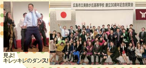
見よ! キレッキレのダンス!